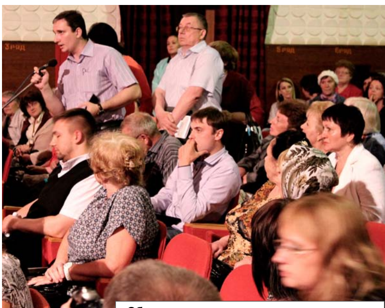
Обеспокоенные создавшимся положением ярцевчане задавали много вопросов